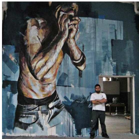
Figura 5 - Fabrizio Visone, murales realizzato alla fabbrica di via Foggia, Torino, progetto Urbe Rigenerazione Urbana, 2011 – murales realizzato al Street art Festival 2011 di Campobasso; ( www.fabriziovisone.com ).